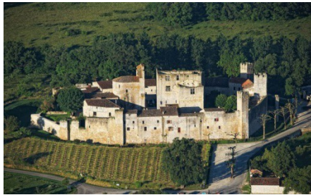
Visite guidée le matin à 10h30 (durée 1h).

Plongez dans l'histoire de la Gascogne , et découvrez Larressingle , l'un des plus beaux et plus petits villages fortifiés de France. Ce petit village fortifié de France, présente un bel ensemble architectural du moyen-âge composé d'un château du XIIIe s , d'ancienne habitation des abbés puis des évêques de Condom, murs d'enceinte, courtines, tours crénelées, fossé, porte d'entrée, église fortifiée du XIIe s, maisons médiévales accolées aux murailles, douves et pont levis. Le village en plein cœur de la campagne viticole gersoise, vous reçoit tel qu'il était au XVIe siècle.