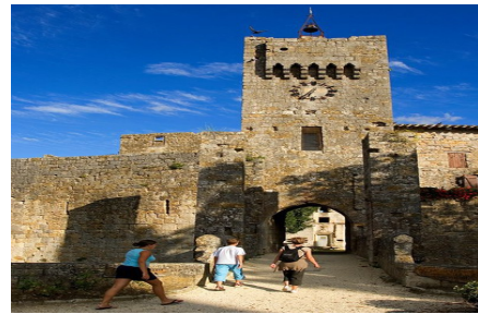
Tarif : 4,80 € / participant 2,80 € / enfant