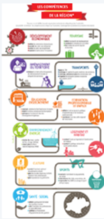
Infographie : les compétences de la Région (PDF)